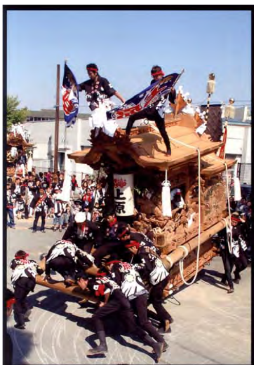
グランプリ作品「雄姿」