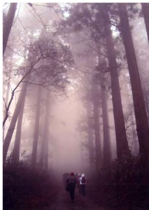
準グランプリ作品「神秘の金剛山」

※上の受賞作品の写真を希望される場合は、広報広聴課（☎0721-53-1111、内線 236・237）までご連絡ください。